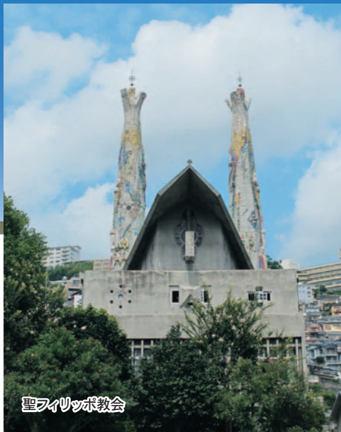
聖フィリッポ教会

ゆとりある行程、デラックスクラスのホテル、学芸員による各施設の 詳細な説明など、熟年層のお客様やご夫妻向けの企画です。