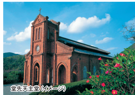
堂先天主堂 (イメージ)

ご旅行条件 (抜粋) お申し込みの際には別途詳細旅行条件書をお受け取りになり、必ずご確認ください。