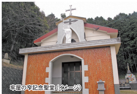
宰屋の宍記念聖堂 (イメージ)