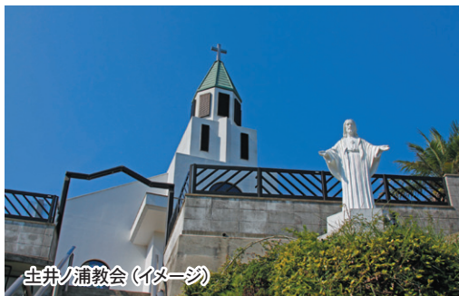
生井ノ浦教会 (イメージ)