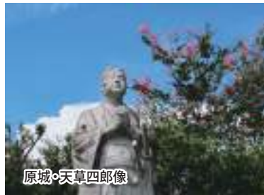
原城・天草四郎像