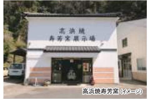
高浜焼寿窯 (イメージ)