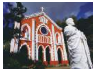
宝亀教会 (イメージ)