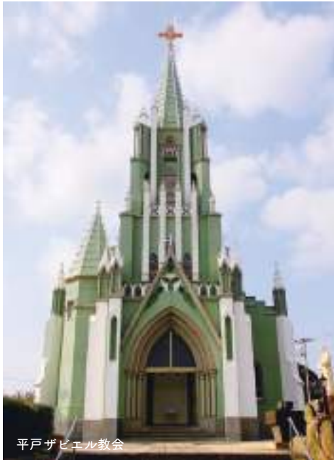
平戸ザビエル教会