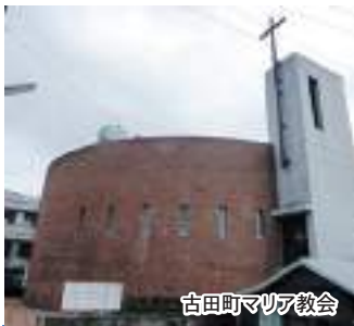
古田町マリア教会

! GoToトラベルキャンペーンは再開後、規定の条件に添って割引を適用させていただく予定です。