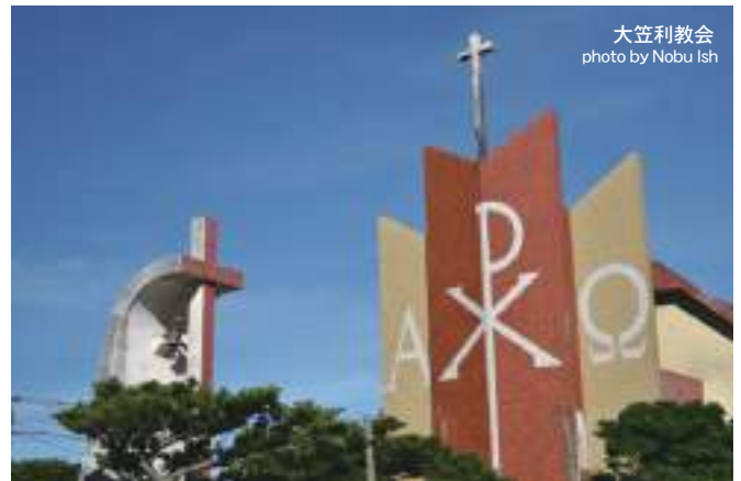
大笠利教会