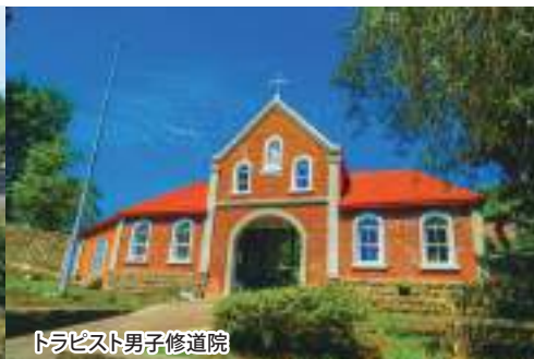
トラピスト男子修道院