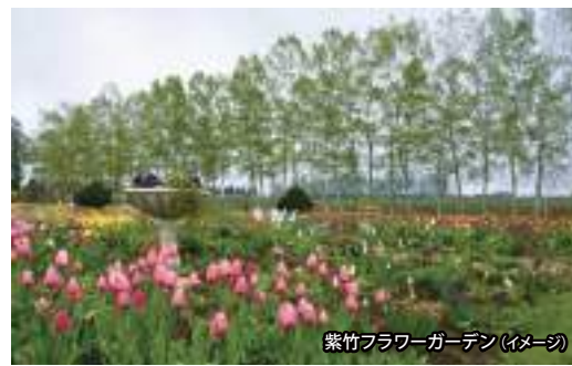
紫竹フラワーガーデン(イメージ)