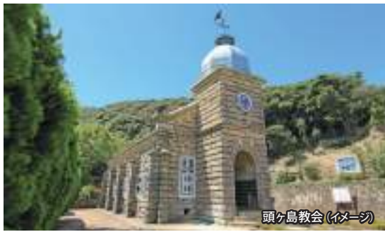
頭ヶ島教会 (イメージ)