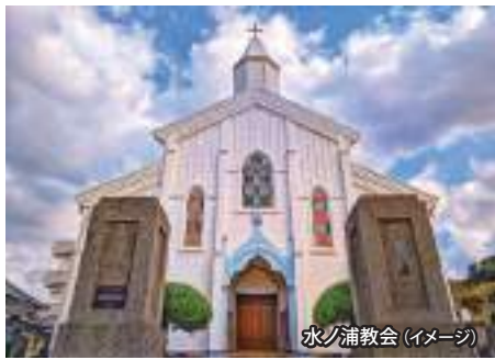
水ノ浦教会 (イメージ)