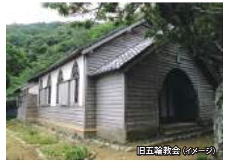
旧五輪教会 (イメージ)

●写真提供：(一社)長崎県観光連盟 (教会の写真掲載については長崎大司教区の許可をいただいています)